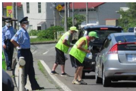
暑い中、お疲れさまでした