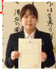
北上からの帰任 辞令交付式より

□内町のみなさん、お元気ですか？ 私は時折口内での写真や動画、広報誌等を見返して口内町に思いを馳せています。石垣では桜が咲き、街中では半袖の人も多く見かけるようになりました。いつか、北上で桜並木を見ることができればなと思っていますし、その際にはまたみなさんとお話したいです。季節の変わり目なので、どうかご自愛ください。みなさんとまたお会いできる日を楽しみにしています！