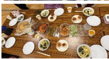
昼食会(気が付いたら味噌づくし！)