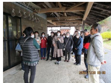
小屋を改修した作業所前で

今回の研修で、障がいのある方の生活の一部、それを支援する人たちの苦労や思いを知ることができました。私たちは多くの人と関わって生きています。時にはあの人のために、みんなのために何か出来ることがあるのではないのでしょうか。