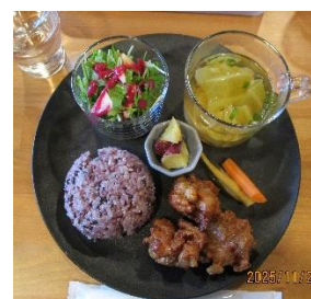
ランチはカフェで