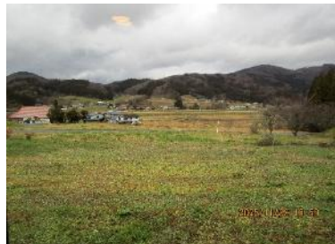
カフェからの眺め