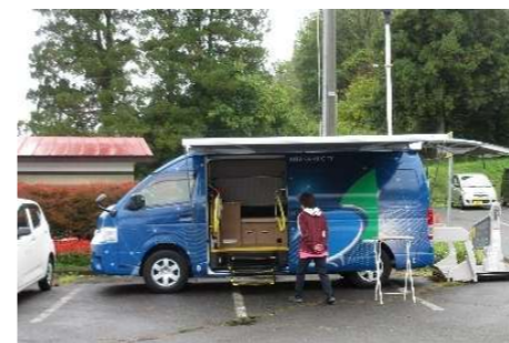
モバイルクリニックの紹介