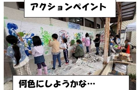
何色にしようかな… 服までペイントした子も…