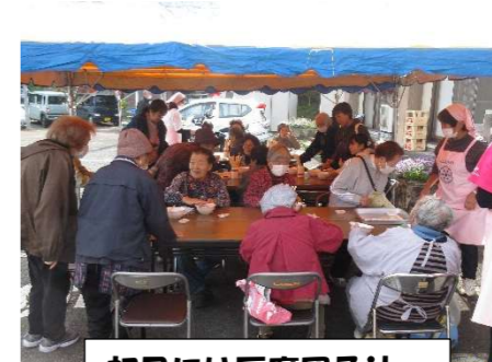
初日には豆腐団子汁 ~おいしい♡~