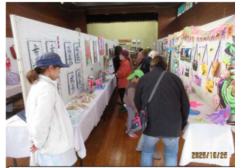
素晴らしい作品がいっぱいです