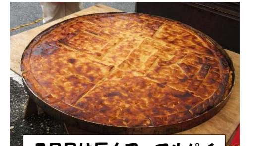
2日目は巨大アップルパイ 焼き上がりました。