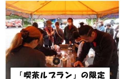
「喫茶ルフラン」の限定 開店。コーヒーの香りに 誘われ行列ができてます