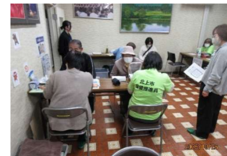
健康まつり 今日の血圧は・・・