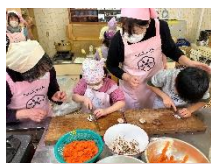
世代間交流 食改協のみなさんと一緒に団子汁を作り百歳体操の方々と世代間交流(福笑い・昔遊び)を行った後に団子汁をみんなまで頂きました★