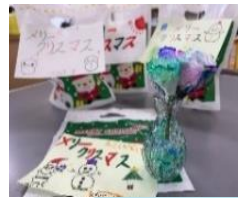
プレゼント配布 キッチンペーパーで作ったお花を町内施設等に配布