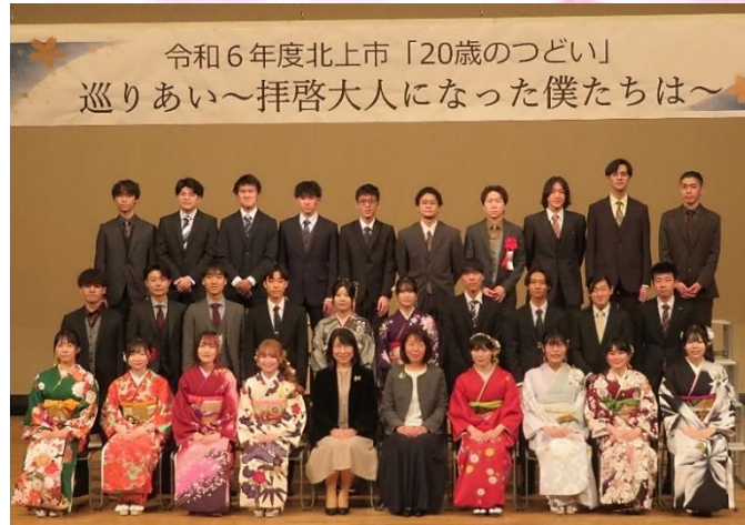
令和6年度北上市「20歳のつどい」 巡りあい～拝啓大人になった僕たちは～

1月12日(日)、令和6年度北上市20歳の集いが開催されました。口内地区の対象者は12名でした(※出席数ではありません)。華やかな着物姿や凛々しいスーツ姿に身を包んで、大人としての自覚と責任を果たす決意を新たにしました。20歳を迎えられた皆様、ご家族の皆様、おめでとうございます。