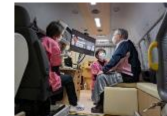
車両及び車内診察イメージ