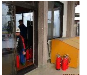
消防班長の模範演技