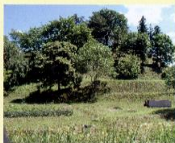
浮牛城趾 (農村公園)