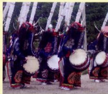
民俗郷土芸能「鹿踊」